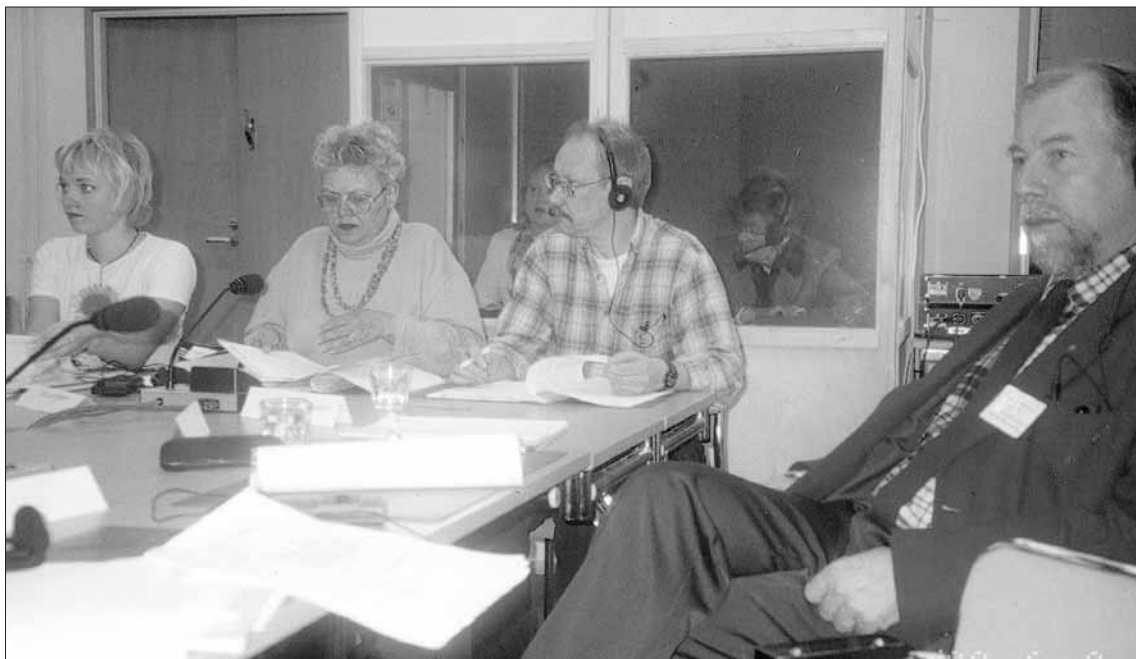
Hlustað á með aðstoð túlks.