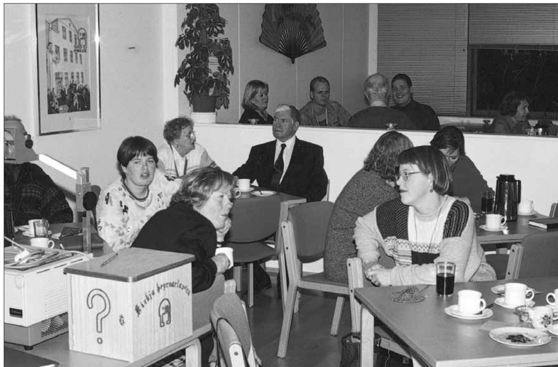
Áhugasamir LAUF félagar á fræðslufundi.