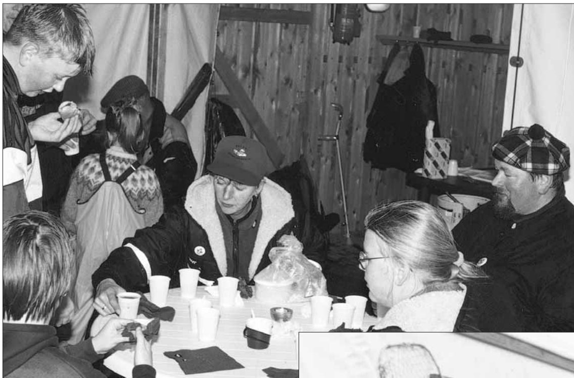
Kát og blaut í veiðiferð.

hversu dugleg börnin voru og undu sér vel við veiði og útiveru. LAUF hafði til umráða stórt og gott samkomutjald þar sem grillað var og snætt og drukkíð ómælt kaffi. Ekki er að efa að í framtíðinni verður einhver slík ferð fyrir félagi og fjölskyldur þeirra árlega á dagskrá félagsins. Eins og sjá má á meðfylgjandi myndum var fólk ekkert að súta vott veður og skín gleði og ánægja úr hvers manns andliti.