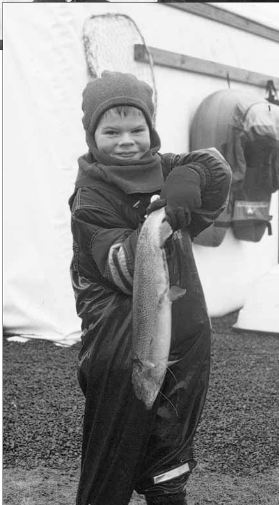
Smár og knár.