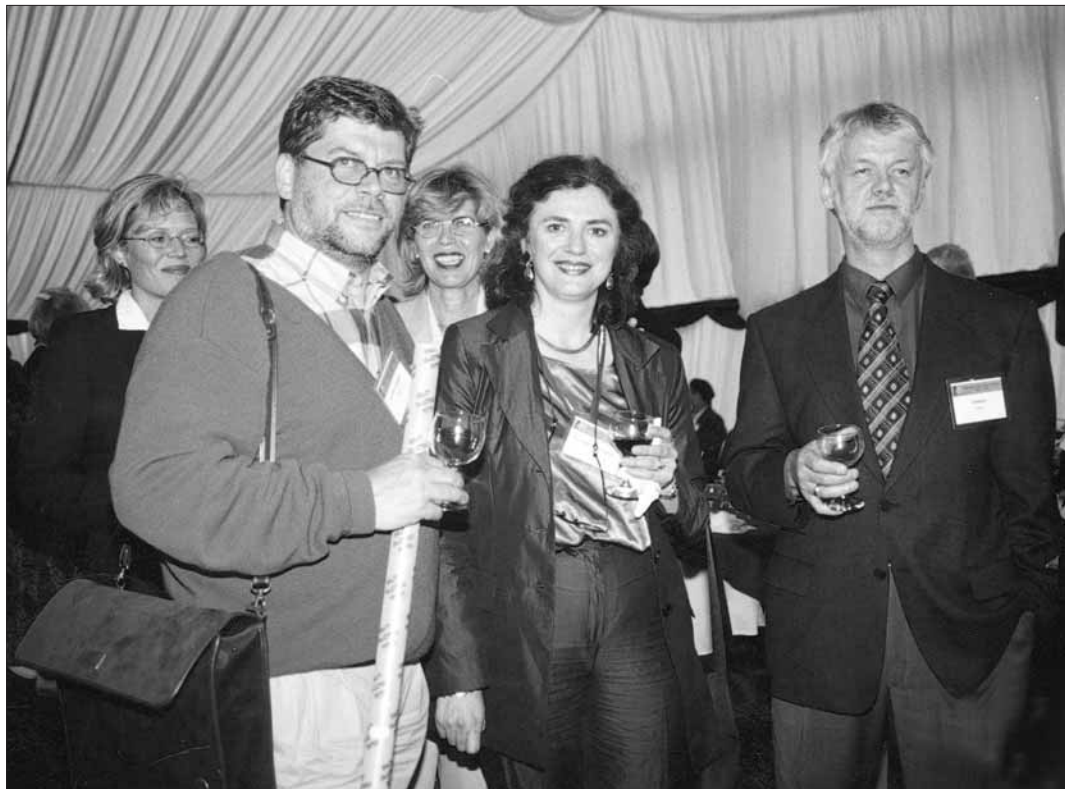
Páttakendur frá Íslandi á ráðstefnu í Dublin 1997.